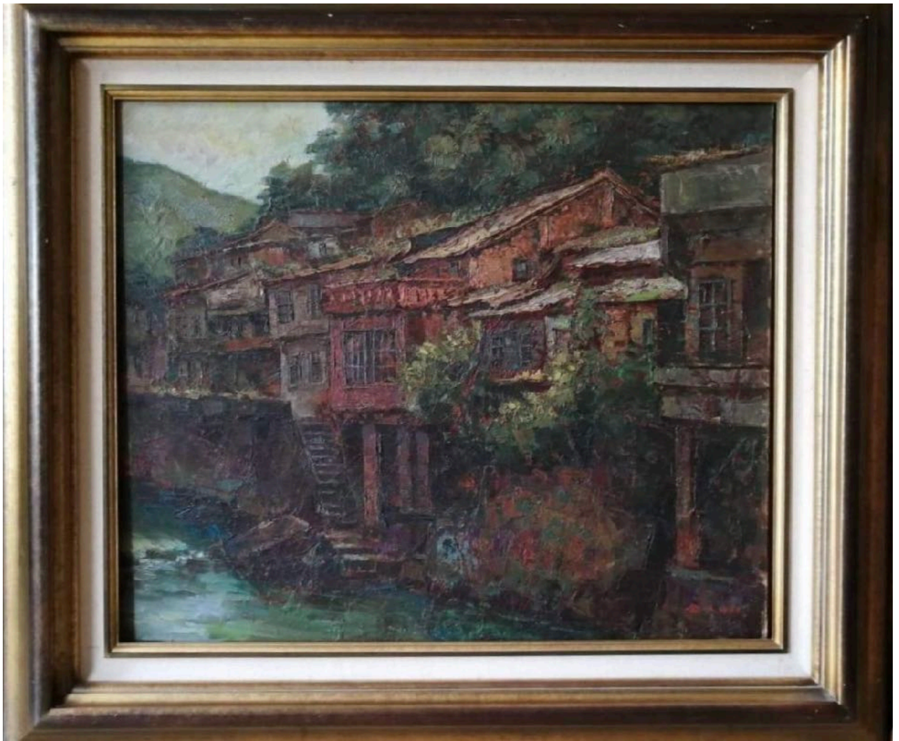
詹金水 石碇溪畔 油彩、畫布 60.5x72.5cm 1990