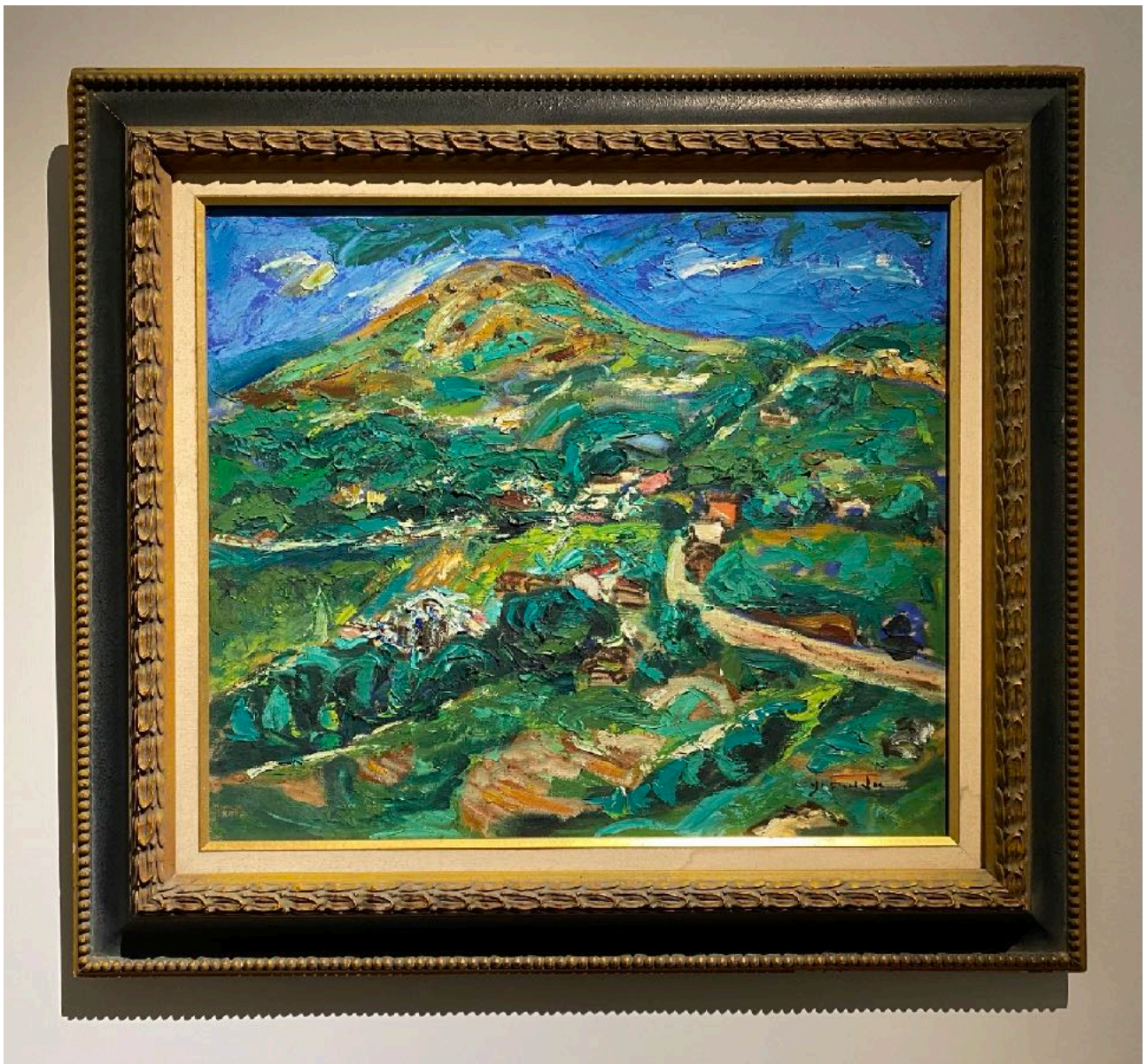
呂義濱 基隆山 油彩、畫布 45.5x53cm 1990