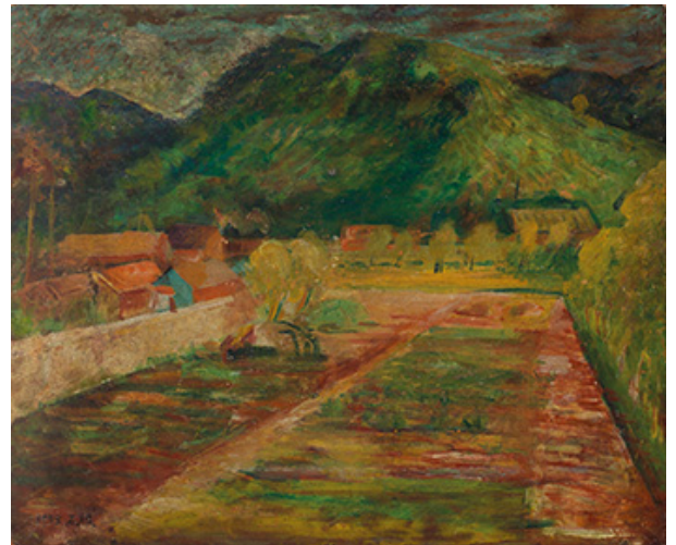
李石樵 百合花與霧峰風景 油彩、木板（雙面畫） 50 x 60.5cm 1958