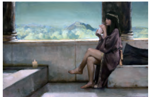
The Peak Oil on Canvas(油畫), 2015 21.5 x 33.5 cm (8 x 13 in)