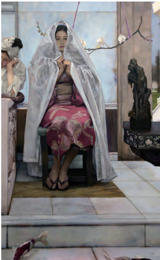
Koi Oil on Canvas(油畫), 2015, 116.5 x 72.5 cm (46 x 28.5 in)