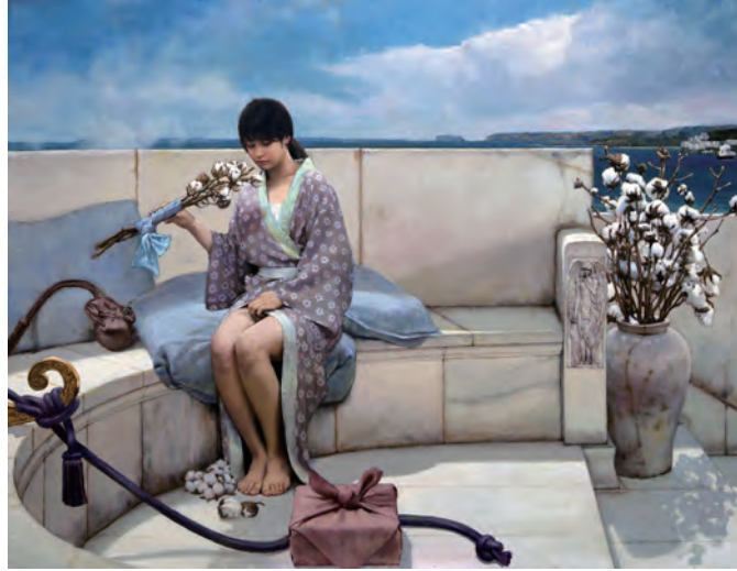
A Bundle of Cotton Oil on Panel (油畫), 2015, 91 x 117 cm (36 x 46 in)