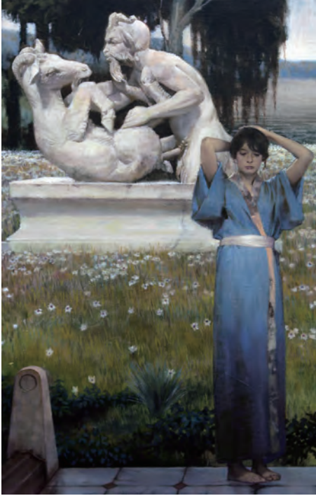
The Isle Shade Oil on Canvas(油畫), 2015 53 x 33 cm (21 x 13 in)